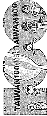
中華民國 精彩一百